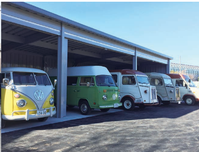
▲イベントで利用するレンタル用の車両