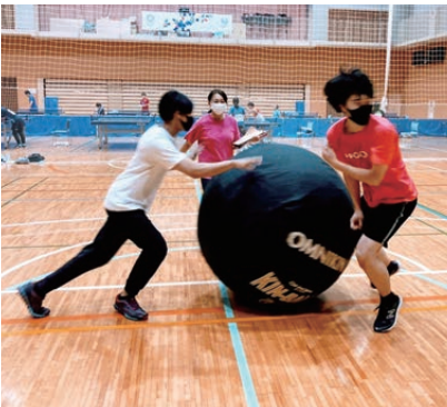
▲スポーツ大会では、巨大なボールを床に落とさないよう、チームで協力し合う競技「キンボール」に挑戦。

本校は通信制高校ですが、登校することを重視しています。今の子どもたちは親以外の大人と接する機会がすくなく少ないんです。だから、親の価値観をそのまま受け継いでしまうことも少なくありません。子ども達には多くの大人たちと接する機会を作ること、世界は広い、そして色々な考え方がある」ということを知って欲しい。そのため練馬キャンパスでは「体験する学び」に力を入れています。また、地域のボランティアや課外学習、外部講師を招いたレクチャーもあります。コロナ前は企業訪問も行っていました。