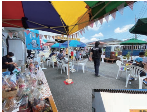
◀地域の方向けに、会社のガレージで定期的にフードイベントを開催。

全国からオーダーが来ますが、現在は関東エリアの問い合わせが9割です。練馬区内の飲食店や農園のキッチンカーも手がけ、地域との繋がりが強まりました。今は一緒にイベントを開催するなど、地域の活性化にも取り組んでいます。