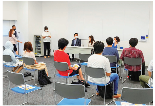
▲高校生を応援する企業によるキャリア研修の様子。協力企業(株)パセリ。

「学校に通えない子ども」が増えている KG 高等学院は茨城県鹿嶋市にある私立高校、鹿島学園を母体にした通信制高校です。練馬キャンパスは2014年に開校して、今年で7年目。初年度の卒業生は2人だけでしたが、ここ5年は毎年20〜25人の生徒が卒業しています。